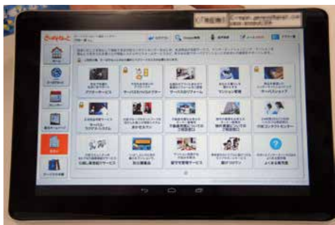
CLIDE タブレットのデモ画面。 お客様はワンタッチで必要な情報に簡単にアクセスできる

マンションのご入居様に引渡し時に自社アプリを入れた状態でタブレットをお配りしています。アプリを使って、マンションでの暮らしに必要な情報をはじめ、生活のサポートサービス、防災情報にアクセスできます。アフターサービスの相談も簡単に行えます。設備系のマニュアルや緊急時の復旧方法、商品カタログなどもダウンロードできるようになっています。管理費の明細も確認できます。弊社では「さーぱすねっと」というポータルサイトを持っていて、タブレットのアプリを使うと、すべてこのポータルサイトに誘導されるようになっています。