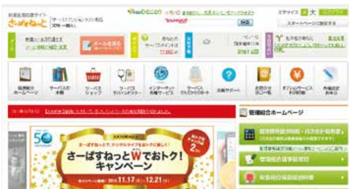
ご入居者様専用のインターネットサービス「さーばすねっと」

穴吹工務店はサーパスマンションというブランドで「住んでからが本当のお付き合い」という企業ポリシーを持ち、マンションを販売しています。またお引渡し後もご入居者様と繋がっていたい、接点をずっと持っていたいという思いがあり、ご入居者様専用のインターネットサービス「さーばすねっと」をご提供しています。