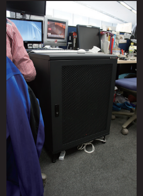
オフィスのデスク周りに設置されたサーバーラック。ラック内にタワー型サーバー、HDD、スイッチ、ケーブルなどが収納されている。