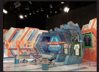
テレビ番組「やべっちF.C.」のスタジオ風景

テックウインドさんからは最新のテクノロジー情報もいただけるので、今後はストレージ容量の拡大、スループットの向上、素材データのインジェストの高速化に重点を置いてシステムを改良していきたいと考えています。