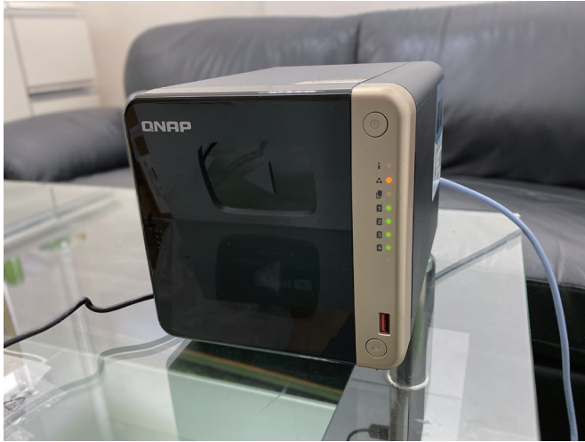
TS-464は、オフィスに置いても違和感を与えないスタイリッシュなデザイン

しやすいというレビューがあったので、安心して使えると思いました。見たことも、触ったこともなく、どういものかもよく分からなかったのですが、高評価のレビューを見てQNAPの4ベイNAS TS-464-8Gに決めました。QNAPは特にレビューをされている方が多かったです。見た目がスタイリッシュでかっこいい点も気に入っています。